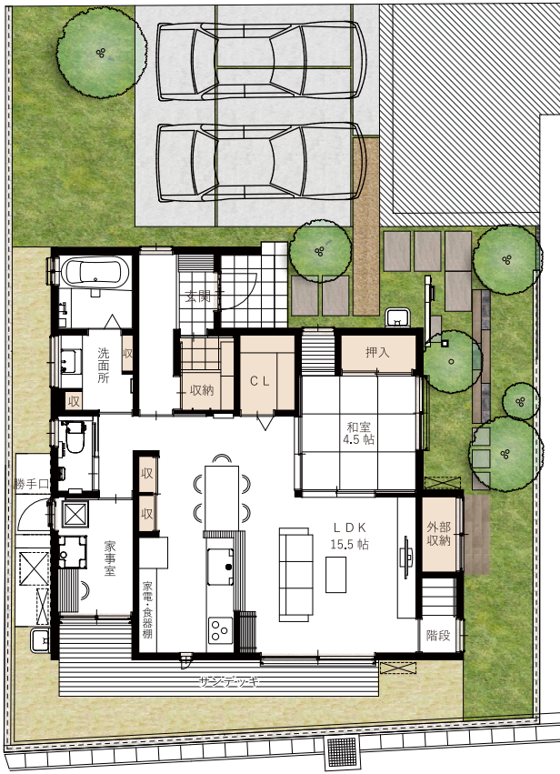
1階配置図及び平面図

※金利0.95% (福岡銀行 3/17 現在の固定金利型 10年 (当初10年間)・オール電化住宅ローン) 返済期間35年にて計算しています。※金利又は融資額は金利情勢や年率などにより変動致します。※端数処理の関係上、返済額は多少の相違があります。予めご了承下さい。